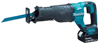
充電式レシプロソー JR187DRGX(6.0Ah) 78,900円(税抜価格)

電源電圧/100V 消費電力/1500W 無負荷打撃回数/分 860打 1回あたりの打撃力/51ジュール 寸法/808×610×209mm 質量/29.9kg 構成/本体、チゼルTE-H28P SM 40 WAVE×1、 チゼルTE-H28P FM 40×1、 台車