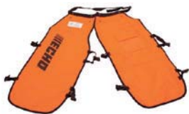
ECHO チャップス 990276-00010