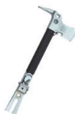
レスキューアックス DPX-2311