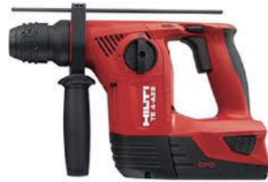
ハンマードリル TE4-A22 P2/5.2Ah コンボ 140,000円(税抜価格)

電源電圧/21.6V ストローク数/分 2600打 ストローク長/32mm 寸法/492×96×196mm 質量/3.8kg(バッテリー含む) 構成/本体、充電器C4/36-350、 バッテリーB22/5.2Li-Ion×2、 ブレードUD 20 1014(5)×5、 本体ケース