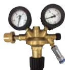
圧力調整器 (別売品)