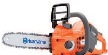
ハスクバーナ 535iXP®(バッテリー充電器付)

バッテリー電圧・容量(Ah) / 50.4V・3.66Ah バー / 35cm 質量 / 本体3.1kg(バッテリー、バー、チェーン除く)