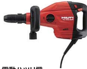
電動ハツリ機 TE-700-AVR 100V コンボ 210,000円(税抜価格)

電源電圧/21.6V 1回あたりの打撃力/2.0ジュール 使用ビット範囲/5~16mmφ 寸法/324×94×201mm 質量/3.3kg(バッテリー含む) 構成/本体、充電器C4/36-350、 バッテリーB22/5.2Li-Ion×2 ドリルビットTE-CX(6)、本体ケース