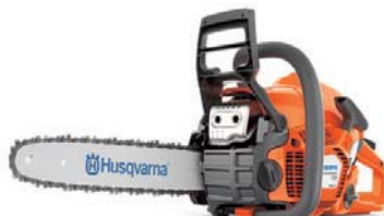
ハスクバーナ 135 Mark II