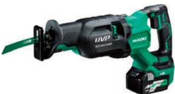
充電式セーバーソー CR36DA 78,800円(税抜価格)

回転数/分 5400 ノコ刃寸法/外径125mm 内径20mm 寸法/256×183×246mm 質量/2.7kg(バッテリー含む) 構成/本体、充電器DC18RF バッテリー-BL1860B×2、 鯨肌チップソー、ケース