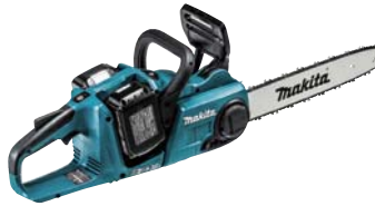
充電式チェンソー MUC353DPG2(6.0Ah) 103,300円(税抜価格)

回転数/分 0~680 打撃数/分 0~4800 寸法/273×86×211mm 質量/2.1kg(バッテリー含む) 構成/本体、充電器DC18RC バッテリー-BL1860B×2、 ケース(ビット別売)