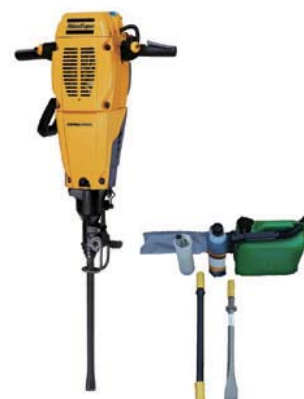
削岩機 コブラコンビ

排気量/41.5cc 燃料/混合ガソリン タンク容量/0.94ℓ 寸法/711×502×364mm 質量/28kg 付属品/チゼル30 1本 オイル止めキャップ