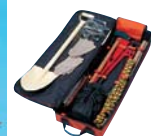
レスキュー・キット BOX型