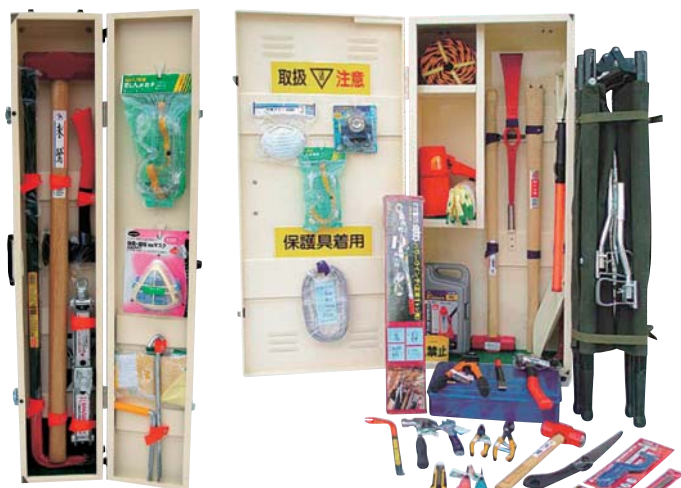
AKレスキュースリム