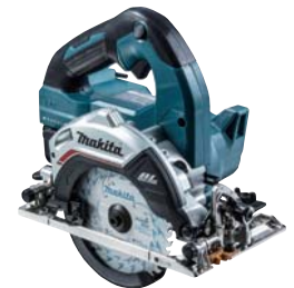
充電式マルノコ HS474DRGX(6.0Ah) 80,700円(税抜価格)

ガイドバー長さ/350mm チェーンスピード/分 0~1200 寸法/773×215×235mm 質量/5.2kg(バッテリー含む) 構成/本体、充電器DC18RD バッテリー-BL1860B×2、 チェーンオイル、 チェーン91PX-52E、 チェーンカバー