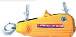
チルホール リバティ X-13