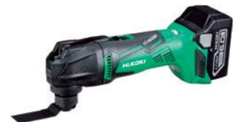
充電式マルチツール CV18DBL(LXPK) 66,800円(税抜価格)

回転数/分 5000(パワーモード時) 2600(サイレントモード時) 寸法/277×236×176mm 質量/2.7kg(バッテリー含む) 構成/本体、急速充電器UC 18YDL バッテリー-BSL 36A18×1、 ケース