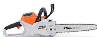
スチール MSA 200 C-BQ(バッテリー充電器付)

バッテリー電圧・容量(Ah) / 36V・4.0Ah バー / 35cm 質量 / 本体2.6kg(バッテリー、バー、チェーン除く)