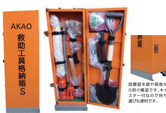
AKAO 救助工具格納箱 S

収納箱材質/スチール 寸法/約1010×300×280mm 総質量/約45kg 色/オレンジ・アイボリー