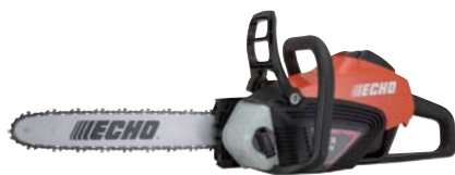
ECHO BCS56V/200(バッテリー充電器付)