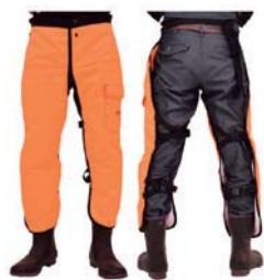
ハートフル チャップス極