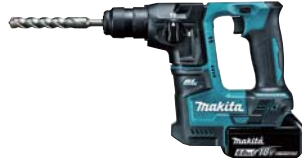
充電式ハンマードリル HR171DRGX(6.0Ah) 72,900円(税抜価格)

ストローク数 回/分 低速0~2300 ストローク数 回/分 高速0~3000 ストローク長/32mm 寸法/439×83×231mm 質量/3.7kg(バッテリー含む) 構成/本体、充電器DC18RC バッテリー-BL1860B×2、 ブレード(BIM48/鉄工)、ケース