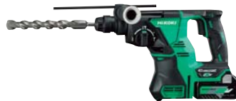
充電式ハンマードリル DH36DPA 93,800円(税抜価格)

ストローク数/分 低速0~1700 ストローク数/分 最高速0~3000 ストローク長/32mm 寸法/457×251×101mm 質量/4.5kg(バッテリー含む) 構成/本体、急速充電器UC 18YDL バッテリー-BSL 36A18、ケース ブレードNo.141S