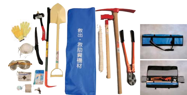
AKレスキューバッグ

収納箱材質/スチール 寸法/約1100×500×300mm 総質量/約72kg 色/アイボリー