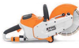
スチール TSA 230

出力/1.2kw 切断深度/76mm 質量/3.5kg ブレード/9インチ(別売) 付属品/バッテリー、充電器各1