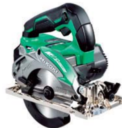
充電式丸のこ C3605DA (XP) 65,700円(税抜価格)

回転数/分 0~1100 打撃数/分 0~4300 寸法/351×220×85mm 質量/3.7kg(バッテリー含む) 構成/本体、急速充電器UC 18YDL バッテリー-BSL 36A18×2、 ケース