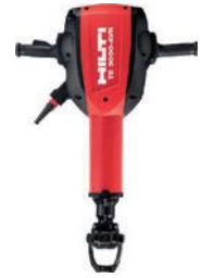
電動コンクリートブレイカー TE-3000-AVR 509,000円(税抜価格)

電源電圧/100V 消費電力/1300W 無負荷打撃回数/分 2760打 1回あたりの打撃力/11.5ジュール 寸法/564×125×248mm 質量/7.9kg 構成/本体、サイドハンドル、 チゼルTE-YP SM 36×1、 チゼルTE-YP FM 36×1、 本体ケース